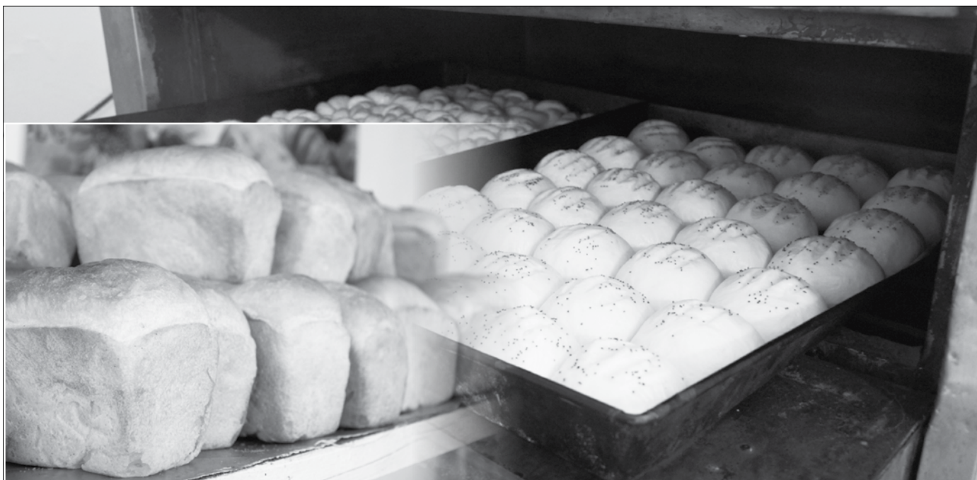
Тұрғындардың кәсіп ашуға талабы таудай

Иә, тек қаражатпен жұмыс жасап, тиын санап қалғандар үшін бұл ақымақтық шығар, алайда «Бал Диқан»