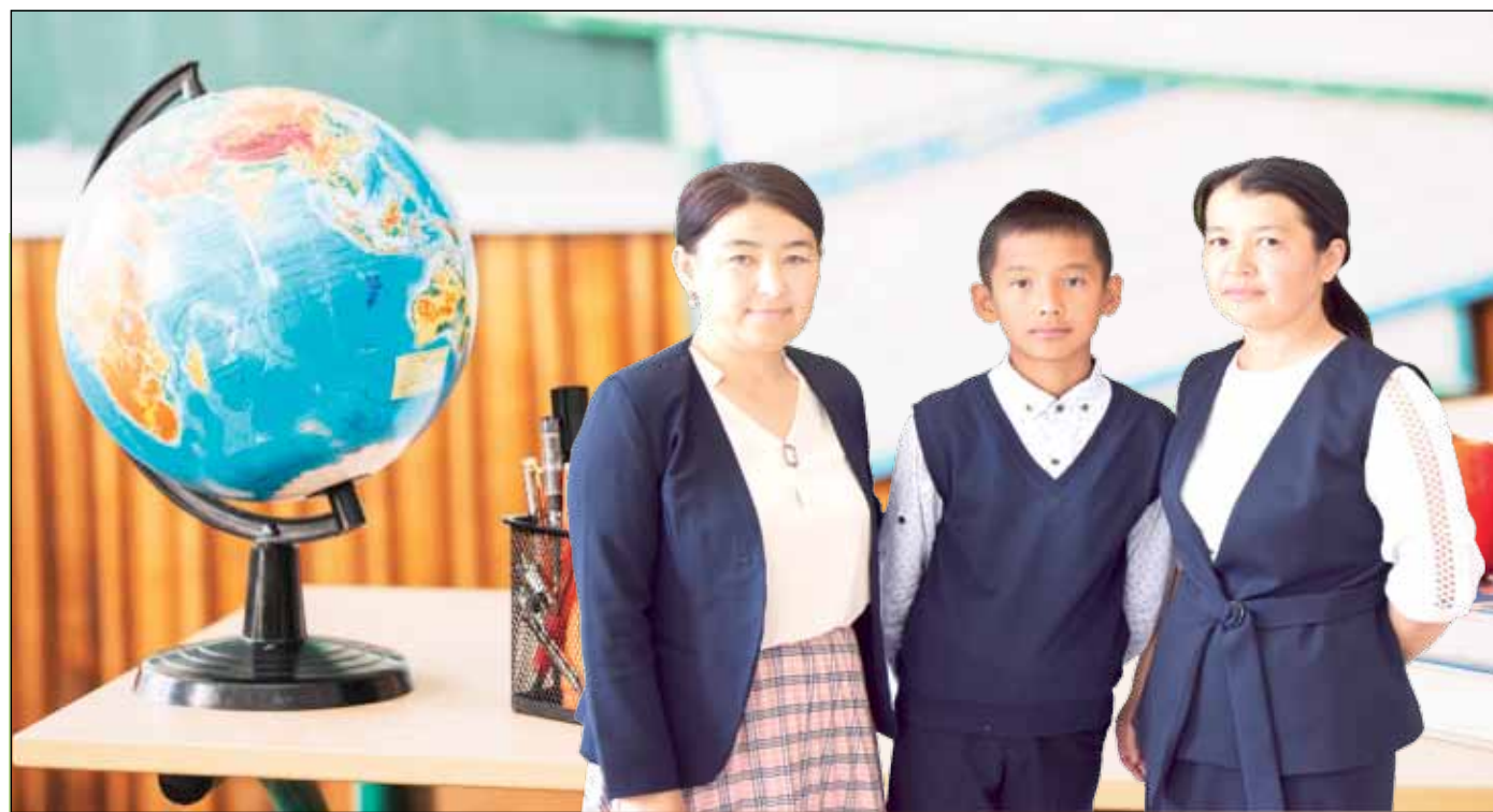
ЕГЕМЕН ЕЛІМІЗДІҢ ЕРТЕҢГІ БОЛАШАҒЫ БҮГІНГІ ЖАСТАРДЫҢ ҚОЛЫНДА. СОНДЫҚТАН ОЛАРҒА БЕРІЛЕТІН БІЛІМ МЕН ТӘРБИЕНІҢ МАҢЫЗЫ ЗОР. ЕЛ БОЛАШАҒЫ ЖОЛЫНДА ӨСКЕЛЕН ҰРПАҚТЫ ОҚЫТЫП, ТӘЛІМ-ТӘРБИЕ БЕРУДІ МАҚСАТ ЕТКЕН ӘБДІКӘРІМ ОҢАЛБАЕВ АТЫНДАҒЫ №117 ОРТА МЕКТЕП – БІЛІМДІЛЕРДІҢ ҚАСИЕТТІ ҚАРА ШАҢЫРАҒЫ. АУЫЛДАҒЫ АЛТЫН ҰЯДАН ОҚУШЫЛАРҒА АРНАЛҒАН «МЫҢ БАЛА» ҰЛТТЫҚ ЗИЯТКЕРЛІК ОЛИМПИАДАСЫНА ҚАТАРЫНАН ЕКІ МӘРТЕ ОЗАТ ОҚУШЫЛАР ҚАТЫСЫП, ЖЕҢІМПАЗ АТАНҒАН.