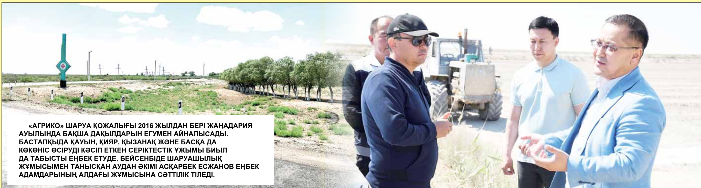
«АГРИКО» ШАРУА ҚОЖАЛЫҒЫ 2016 ЖЫЛДАН БЕРІ ЖАҢАДАРИЯ АУЫЛЫНДА БАҚША ДАҚЫЛДАРЫН ЕГУМЕН АЙНАЛЫСАДЫ. БАСТАПҚЫДА ҚАУЫН, ҚИЯР, ҚЫЗАНАҚ ЖӘНЕ БАСҚА ДА КӨКӨНІС ӨСІРУДІ КӘСІП ЕТКЕН СЕРІКТЕСТІК ҰЖЫМЫ БИЫЛ ДА ТАБЫСТЫ ЕҢБЕК ЕТУДЕ. БЕЙСЕНБІДЕ ШАРУАШЫЛЫҚ ЖҰМЫСЫМЕН ТАНЫСҚАН АУДАН ӘКІМІ АСҚАРБЕК ЕСЖАНОВ ЕҢБЕК АДАМДАРЫНЫҢ АЛДАҒЫ ЖҰМЫСЫНА СӘТТІЛІК ТІЛЕДІ.