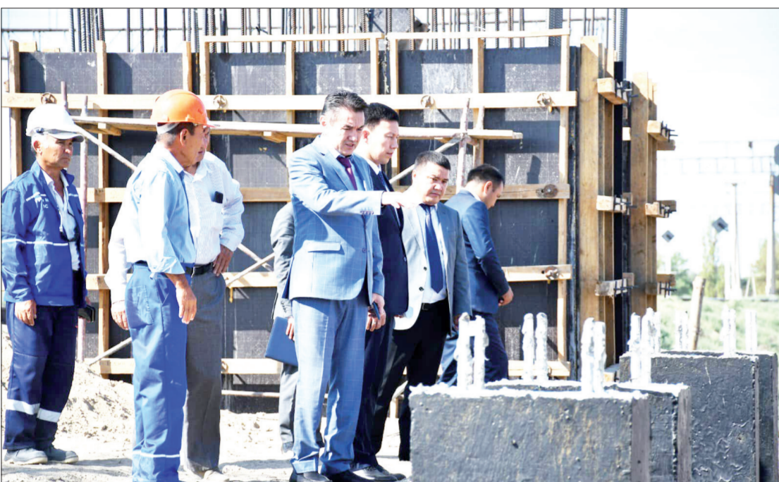
СӘРСЕНБІНІҢ СӘТТІ КҮНІ ОБЛЫС ӘКІМІНІҢ ОРЫНБАСАРЫ НҰРЫМБЕТ САҚТАҒАНОВ АУДАҢА ЖҰМЫС САПАРЫМЕН КЕЛДІ. ІС-САПАР БАРЫСЫНДА Қ.НҰРПЕЙІСОВ КӨШЕСІНЕ ЖҮРГІЗІЛІП ЖАТҚАН КҮРДЕЛІ ЖӨНДЕУ ЖҰМЫСТАРЫ, ЖАЛАҒАШ КЕНТІНЕН ТЕМІР ЖОЛ АРҚЫЛЫ ӨТЕТІН ЖАЯУ ЖҮРГІНШІЛЕР КӨПІРІНІ ҚҰРЫЛЫСЫМЕН ЖӘНЕ АУДАНДЫҚ КІТАПХАНА ҒИМАРАТЫНЫҢ ЖЫЛУ ҚАЗАНДЫҒЫН ТАБИҒИ ГАЗҒА АУЫСТЫРУ ЖҰМЫСТАРЫМЕН ТАНЫСТЫ.