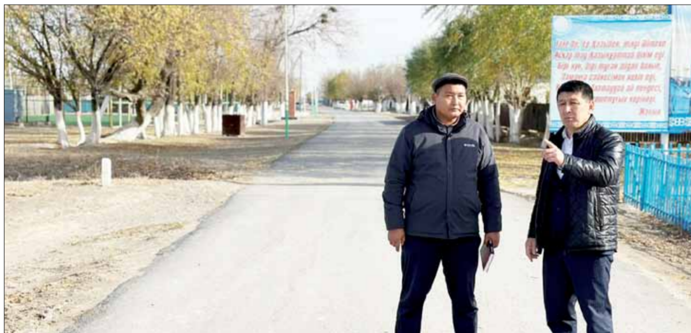
Қаракеткеннің тарихы қалай?