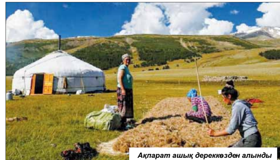
Ақпарат ашық дереккөзден алынды