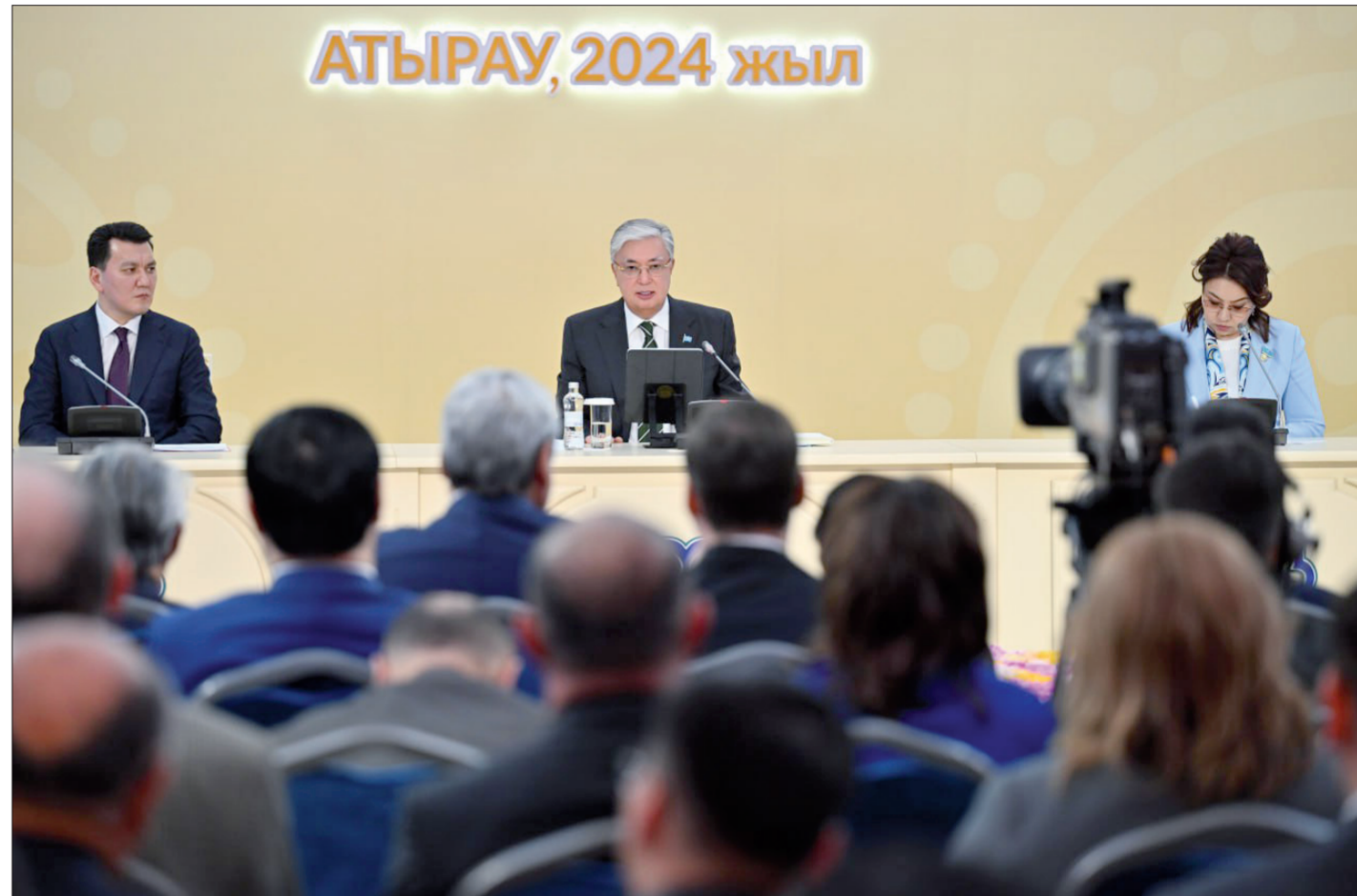
АТЫРАУ, 2024 ЖЫЛ

Қасым-Жомарт Тоқаев ұлттық құндылықтар жүйесін құруды ұсынып, қоғамда белең алған теріс әрекеттерді сындады, осы ретте ол әрбір қазақ ата-бабасын құрметтеп, рухына тағзым ететінін айтып, шежіре мәдени қодымыздың ажырама бөлігіне айналғанын да жасыр-