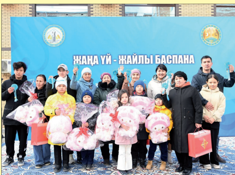
ЖАҢА ҮЙ - ЖАЙЛЫ БАСПАНА