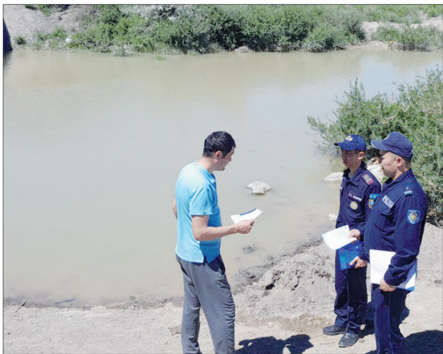
20 күнде 27 адам суға кеткен

Төтенше жағдайлар министрлігінің мәліметінше, елімізде жыл басынан бері 45 адам, ал 1 маусымнан бері 27 адам суға кеткен. Министрліктің халықты қорғау бойынша қабылдаған шараларының нәтижесінде 2020 жылдан бері суға батып қаза тапқандар саны 437-ден 227-ге азайған.