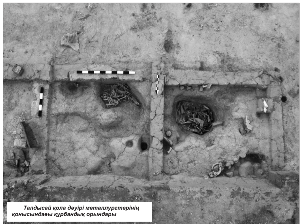
Талдысай қола дәуірі металлургиялық қонысындағы құрбандық орындары

Ежелгі металлургияның жылдам дамуының негізі мыс еді. Бұл металл қазақ жерін әлемдегі тау-кен, металлургия орталықтарының біріне айналдырды. Евразия аумағында көне металлургия өндірісінің пайда болып, дамуы барысындағы ірі орталықтардың бірегейі Орталық Қазақстан болып табылады. Археология мен топонимика деректері бұл жердің мұрасы ежелден-ақ тау-кен орындары және металлургия өндірісімен тығыз байланысты екенін куәландырады. Сарыарқаның мыс кеніштері Жезқазған, Кенқазған, Қоңырат, Жездінің тарихи мәні өз зерттеушілерін қызықтырады анық. Осындай іргелі кешендердің бірі Жезқазған өңірінде орналасқан.