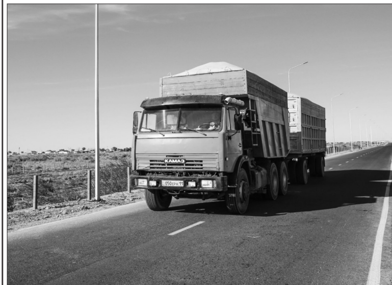
22 мың тонна ауыл шаруашылығы өнімдері экспортталған

Биыл облыс бойынша 191,5 мың гектарға ауыл шаруашылығы дақылдары орналастырылған. Оның ішінде негізгі дақыл күріштің көлемі 83,1 мың гектарды құрайды. Өткен жылмен салыстырғанда жалпы егіс көлемі 2,9 мың гектарға, оның ішінде күріштің көлемі 7,8 мың гектарға азайтылған. Биылғы жылы да ауыл шаруашылығы дақылдарының өсіс көлемдерін ертаратандыру жұмыстары жалғасын тапқан. Нәтижесінде қысқартылған күріш егісіннің орнына суды аз қажет ететін мал азықтық, майлы дақылдар мен картоп, көкөніс дақылдарының өсіс көлемдері ұлғайтылған. Бұдан бөлек облыс әкімінің тапсырмасына сәйкес жергілікті тұрғындарды өзін-өзі әлеуметтік маңызы бар картоп, көкөніс, бақша өнімдерімен қамтамасыз ету бағытында 5 мың отбасына ұжымдық түрде бақша егуге қосымша 3 364,4 гектар жер дайындалған. Бүгінде 2 225 отбасы дайындалған 1 615 гектар жерге егіс еккен, оның ішінде 192 гектарға картоп, 410 гектарға көкөніс, 631 гектарға бақша дақылдары орналастырылған.