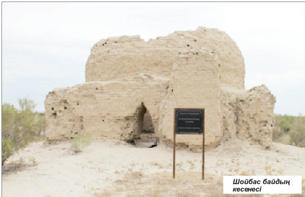
Шойбас байдның кесенесі