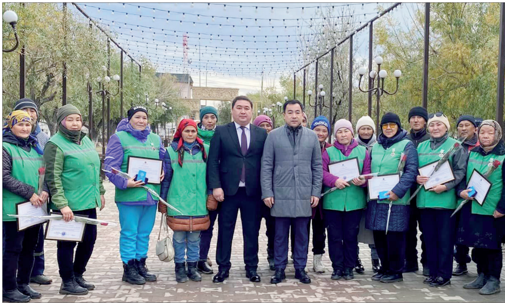
Жақында жаңалықтан оқыдым, Финляндияда жылдың ең үздік марапаты саналатын «Жыл адамы» аталымына қар тазалаушы лайық деп танылған. Өркениетті елдердегі қарапайым жұмысшының қоғамдағы жоғары мәртебесін осыдан-ақ байқауға болады.