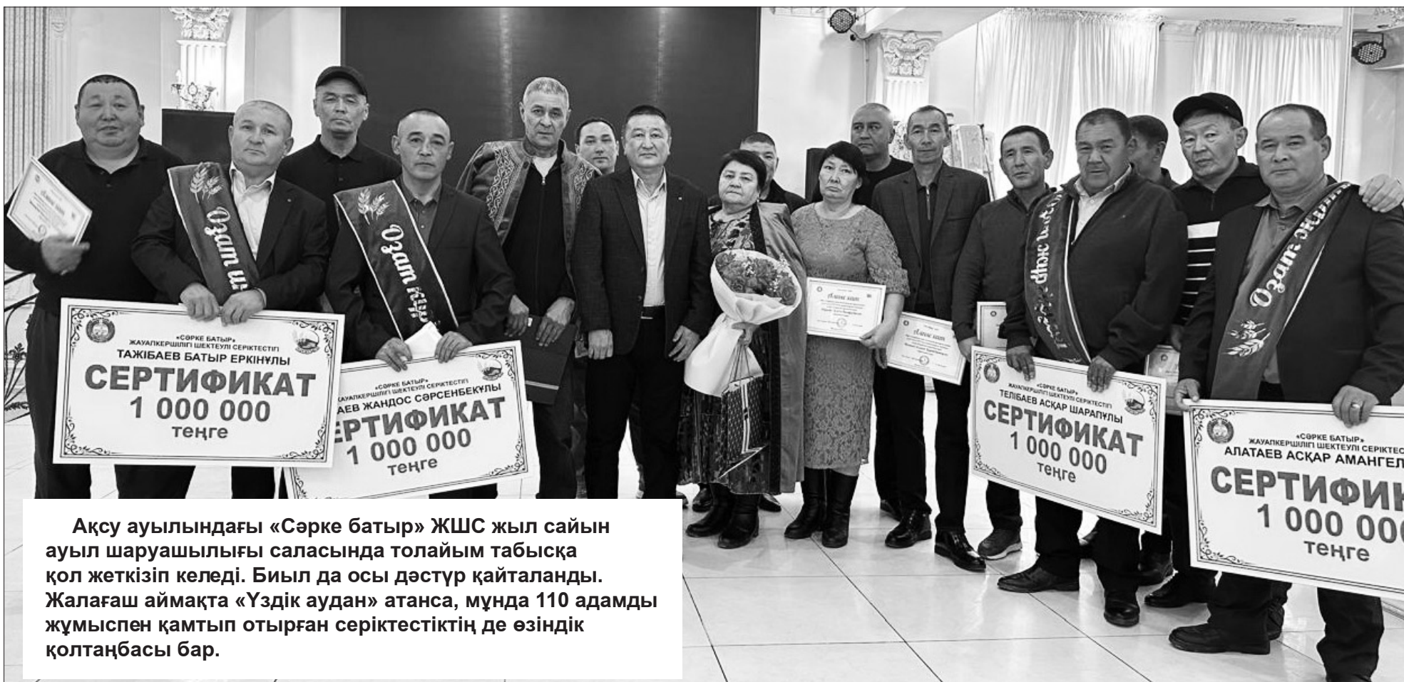
Ақсу ауылындағы «Сәрке батыр» ЖШС жыл сайын ауыл шаруашылығы саласында толайым табысқа қол жеткізіп келеді. Биыл да осы дәстүр қайталады. Жалағаш аймақта «Үздік аудан» атанса, мұнда 110 адамды жұмыспен қамтып отырған серіктестіктің де өзіндік қолтаңбасы бар.