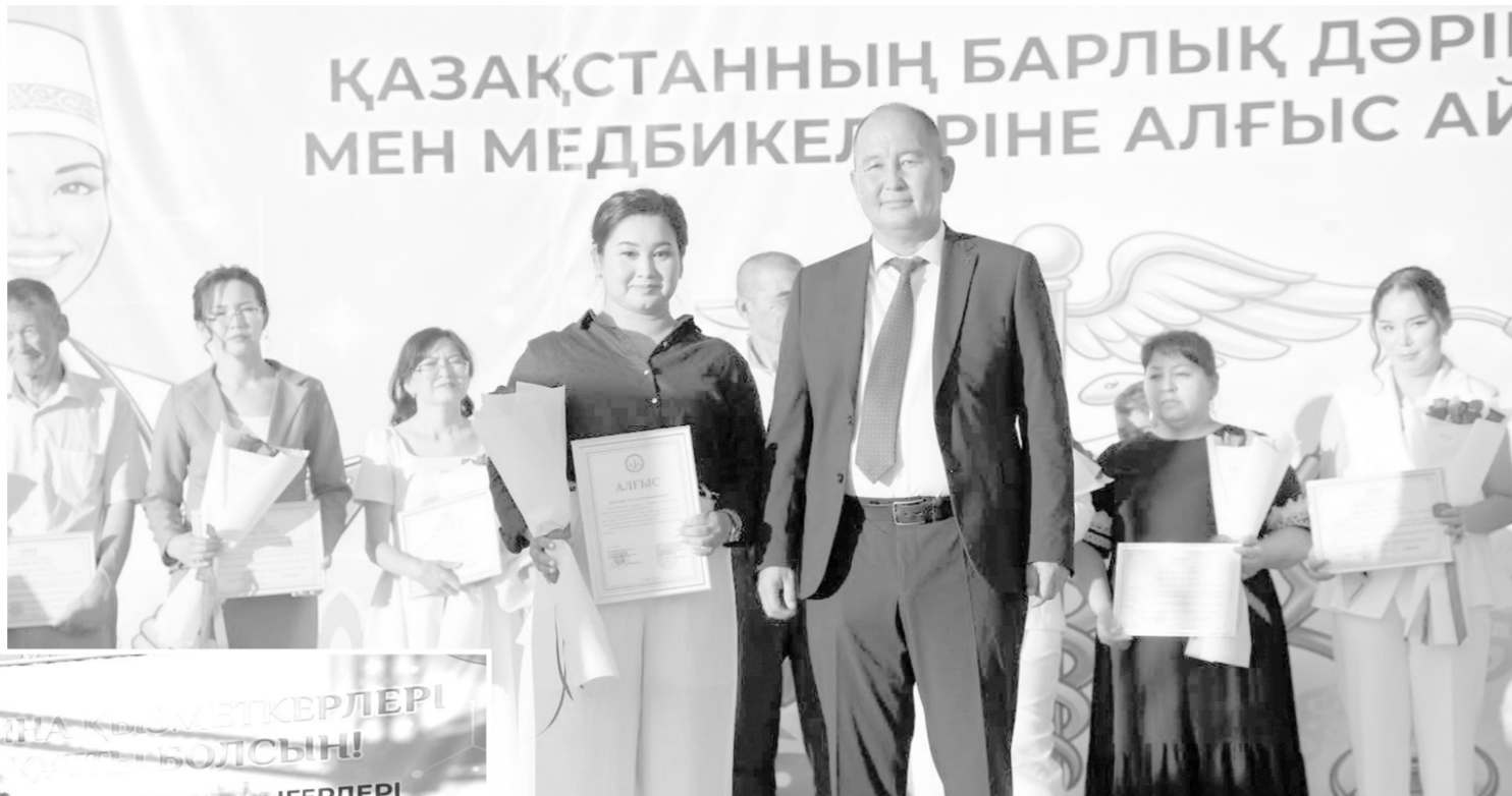
ҚАЗАҚСТАННЫҢ БАРЛЫҚ ДӘРІГЕРІ МЕН МЕДБИКЕЛЕРІНЕ АЛҒЫС АЙ

Әлемде саналуан мамандық бар. Алайда олардың ішінде халықтың денсаулығын уақытпен санаспай күзететін ақшалатты абзал жандардың орны ерекше. Басмыз ауырып, балтырымыз сыздаса, ең алдымен дәрігердің көмегіне жүгінеміз. Әр науқастың жанына желеу болып, күн-түн демей тұрғындардың жанынан табылатын дәрігерлерге қандай құрмет көрсетсе те артық етпейді. Адам жанының сақшысы