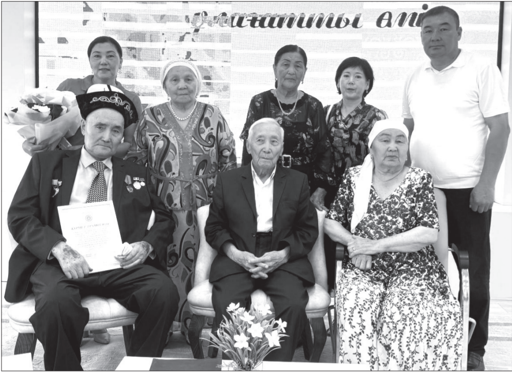
«Қариясы бар елдің қазынасы бар» дейді дана халқымыз. Расында, ұрпаққа өнеге болар өнегелі өмір иелері, ақылдың кеніне айналған ақсақалдар мен ақсаулықты аналар – қоғамның рухани тірегі, елдің өткенін бүгінге жалғайтын алтын көпірі.

«Адамның өмір – жолы бір кітап» десек, оның әрбір парағы мағыналы еңбекпен, адалдықпен, мейіріммен және адамгершілікпен жазылуы тиіс. Кейбір жандар бар, олардың жүріп өткен жолы бір отбасының ғана емес, тұтас бір елдің тарихымен астасып жатады. Осындай ғибратты ғұмыр кешіп, саналы өмірін ел игілігіне арнаған ардагерлерді ардақтау – кейінгі буынның қасиетті парызы. Осы орайда аудандық ардагерлер кеңесімен бірлесіп ұйымдастырылған «Ғибратты ғұмыр – ұлағатты өмір» атты салтанатты кездесу кеші өмірдің жиі белесіне көтерілген, сексеннің сеніріне шыққан ардақты жандарға деген құрметтің айқын көрінісі болды.