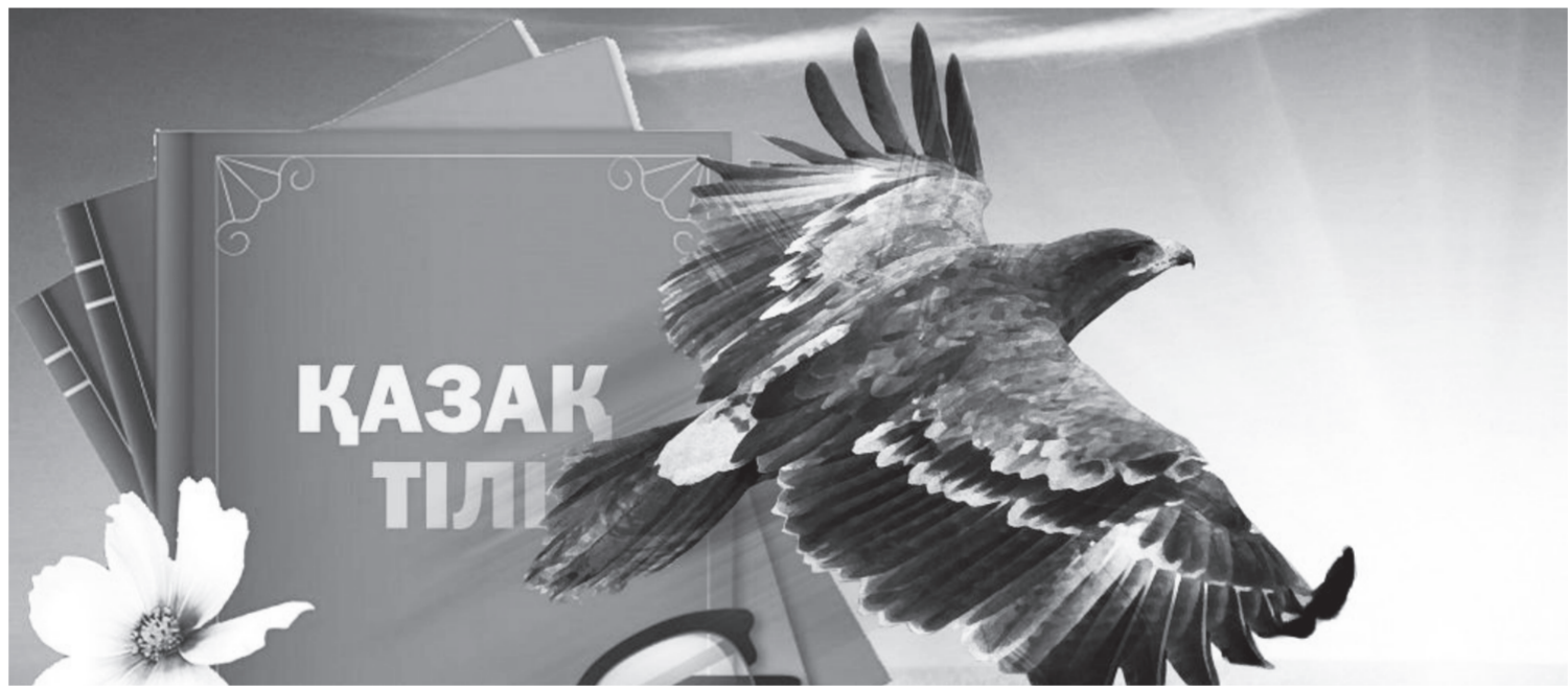
«Тіл жоғалған халықтың өзі де жоғалады» деген қанатты сөздің астарында терең мағына жатыр. Тіл – халықтың жаны, ұлттың рухы, елдіктің ең асыл белгісі. Ана тілі арқылы адам туған халқының тарихын таныды, мәдениетін меңгереді, салт-дәстүрін бойына сіңіреді. Сондықтан мемлекеттің тілдің мәртебесін көтеру – әрбір азаматтың қасиетті борышы.

Тіл – адамзат баласына берілген ең ұлы қазына. Жер бетінде мыңдаған ұлт пен ұлыс өмір сүрсе, олардың әрқайсысының өзіндік болмысын айқындайтын басты ерекшелігі – тілі. Халықтың сан ғасырлық тарихы, рухани байлығы, дүниетанымы мен өмірлік тәжірибесі тіл арқылы ұрпақтан-ұрпаққа жалғасып отырады. Сондықтан ана тілін құрметтеу – ата-баба мұрасын құрметтеу деген сөз.