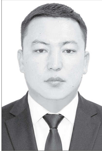
Қазақта «Ауыл – елдің алтын бесігі» деген тағымалды сөз бар. Ауылдың өркендеуі – елдің өркендеуі, ауылдың көркеюі – халықтың тұрмыс сапасының артуы.

Бүгінде Аққыр ауылы жаңару мен жаңғырудың жаңа кезеңіне қадам басып келеді. Ауылда кәсіпкерлік маңызын нысандар жаңарып, әлеуметтік салаларда өзгерістер жүзеге асуда. Дегенмен уақыт бір орында тұрмайды. Елдің талап-тілегі де, заманның сұранысы да күн сайын артып келеді. Сондықтан ауылдың дамуына жаңа деңгейге көтеру – баршамыздың ортақ мақсатымыз.