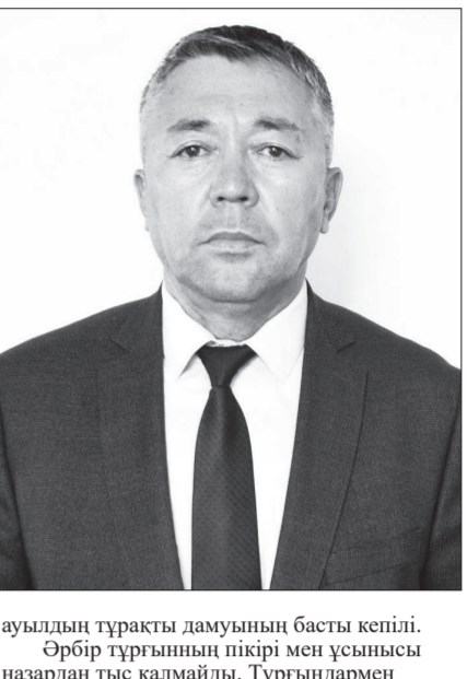
ауылдың тұрақты дамуының басты кепілі. Әрбір тұрғынның пікірі мен ұсынысын назардан тыс қалмайды. Тұрғындармен тұрақты кездесулер өткізу, маңызды мәселелерді халықпен бірлесіп талқылау, әлеуметтік желілер арқылы кері байланысты күшейту және мемлекеттік қызметтердің қолжетімділігін арттыру бағытындағы жұмыстар жүргізіледі. Ашықтық пен әділдік – ел басқаруының басты қағидасы болуы тиіс.

Қоғамның дамуы оның әлеуетіне тәуелді. Дегенмен дамуға қажетті ресурстарды қолдану, олардың тиімді пайдаланылуына қолдау көрсету, мүмкіндігі шектеулі азаматтардың өмір сүру сапасын жақсарту бағытындағы жұмыстар әрдайым жалғасын табады. Қоғамдық ұйымдармен бірлесіп жұмыс жүргізу, қоғамдық келісім мен тұрақтылықты сақтау, бірлік пен татулықты нығайту –