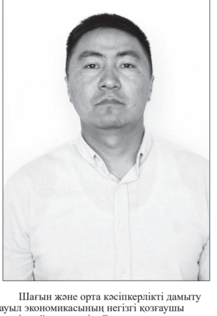
Шағын және орта кәсіпкерлікті дамыту ауыл экономикасының негізгі қозғалышы күйіне айналуы тиіс. Сондықтан жаңа өндіріс орындарын ашуға, қызмет көрсету саласын дамытуға және ауыл шаруашылығы өнімдерін өңдеу бағытындағы жобаларды жүзеге асыруға қолдау көрсетіледі. Бұл өз кезегінде жаңа жұмыс орындарының ашылуына және халықтың тұрмыс деңгейінің жақсаруына ықпал етеді.