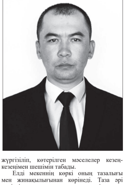
Мемлекеттік қызметте еңбек еткен жылдары жауапкершілік пен әділдіктің маңызын терең түсіндім. Халықпен жұмыс істеу әрбір өтіншіке мұқият қарауы, заң талаптарын сақтауы және кез келген мәселені жан-жақты зерттеуді талап етеді. Осы уақыт ішінде жинақталған тәжірибемді М.Шәменов ауылдық округінің игілігіне бағыттап, тұрғындардың әл-ауқатын арттыру жолында адал қызмет етуге дайынмын.

Елдің тұрақты дамуы мен халықтың әл-ауқаты ең алдымен өмірдің өркендеуімен тығыз байланысты. Тұрғындардың өмір сүру сапасын жақсарту, қолайлы орта қалыптастыру, жаңа мүмкіндіктерге жол ашу және елді мекеннің әлеуетін тиімді пайдалану – маңызды міндет. Мемлекет тарапынан бұл бағытта ауқымды жұмыстар атқарылып келеді. Дегенмен әрбір өңірдің өзіндік ерекшелігі, шешімін жұмыс мәселелері мен тұрғындардың сұранысы бар. Сондықтан жергілікті жердің дамуы нақты жоспарға, халықтың пікіріне және жүйелі жұмысқа негізделуі қажет.