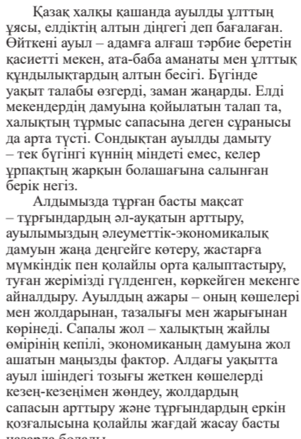
Қазақ халқы қашанда ауылды ұлттың ұясы, елдіктің алтын дінгеі деп бағалаған. Өйткені ауыл – адамға алғаш тәрбие беретін қасиетті мекен, ата-баба аманаты мен ұлттық құндылықтардың алтын бесігі.

Бүгінде Аққыр ауылы жаңару мен жаңғырудың жаңа кезеңіне қадам басып келеді. Ауылда кәсіпкерлік маңызын нысандар жаңарып, әлеуметтік салаларда өзгерістер жүзеге асуда. Дегенмен уақыт бір орында тұрмайды. Елдің талап-тілегі де, заманның сұранысы да күн сайын артып келеді. Сондықтан ауылдың дамуына жаңа деңгейге көтеру – баршамыздың ортақ мақсатымыз.